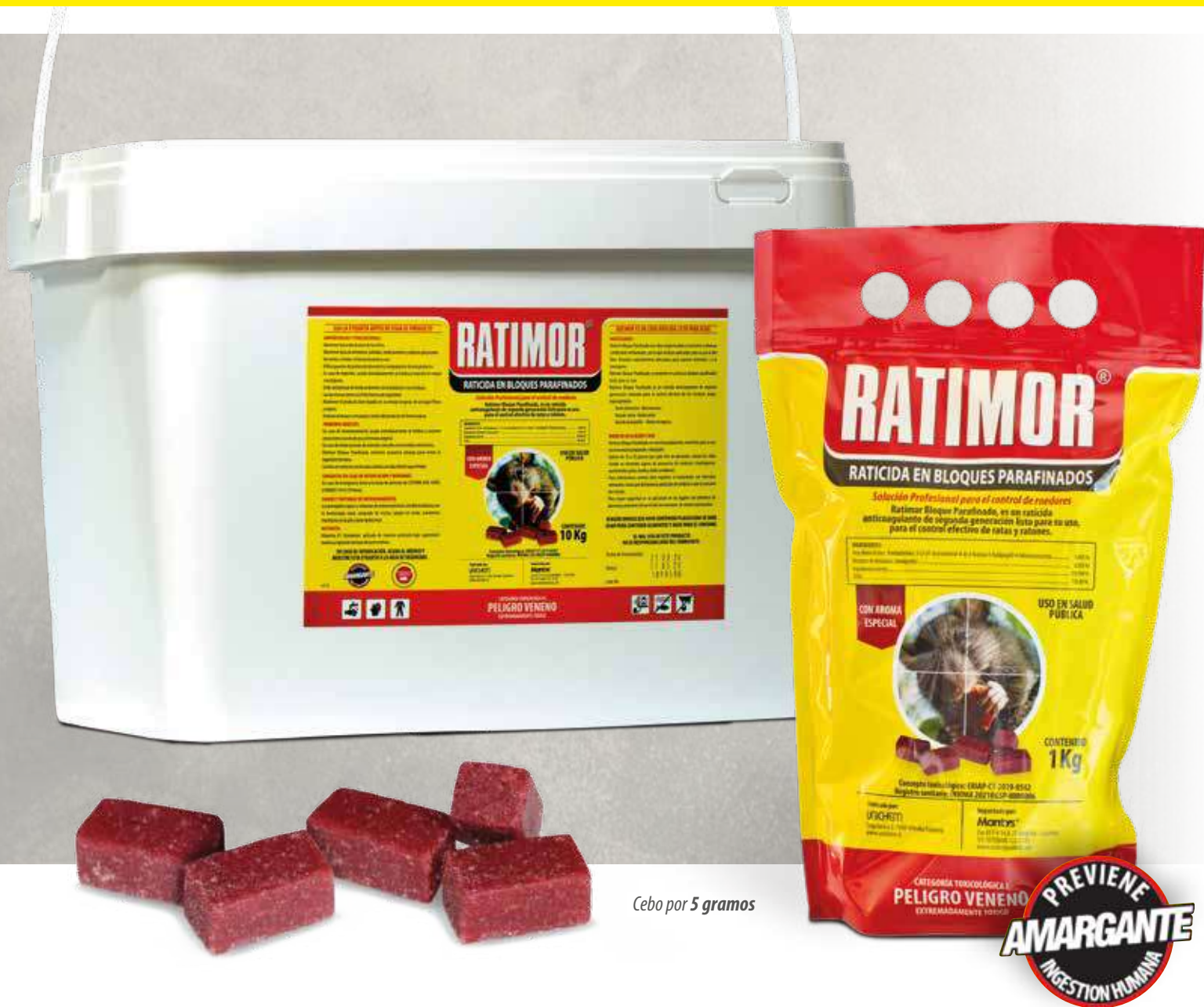
Cebo por 5 gramos