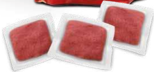
Cebos por 10 gramos